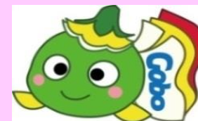
ハローワーク御坊マスコットキャラクター まめぴー