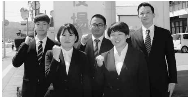
今年度採用の新規職員たち

日高町のために働きたい人、日高町のまちづくりに参加したい人、ぜひご応募ください。